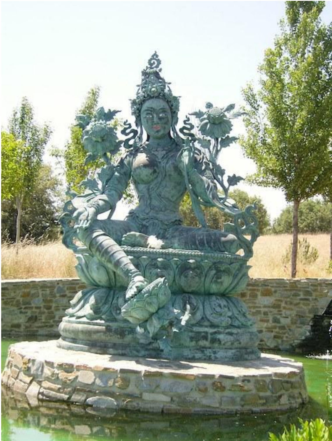
Traducido al castellano por un grupo anónimo de traductores en el Centro de Retiros O Sel Ling, en Granada, España.